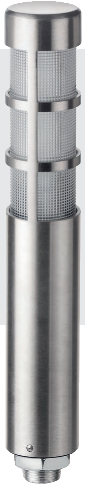
Size comparison deSIGN 42 / KombiSIGN 72